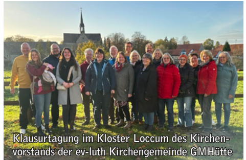
Klausurtagung im Kloster Loccum des Kirchenvorstands der ev-luth Kirchengemeinde GMHütte

Der im März gewählte Kirchenvorstand der evangelisch-lutherischen Kirchengemeinde Georgsmarienhütte traf sich zu einer dreitägigen Klausurtagung im Kloster Loccum. Neben inhaltlichen Diskussionen zur Struktur und Ausrichtung der fusionierten Kirchengemeinde (Auferstehung, König-Christus und Luther) blieb bei herrlichem Herbstwetter auch Zeit für Besinnung und Stärkung in der Gemeinschaft. Ausschüsse und Teams wie Bau, Finanzen, Gottesdienst, Personal, Diakonie, Öffentlichkeitsarbeit, Senioren, Kinder-Jugend-Familie wurden gebildet.