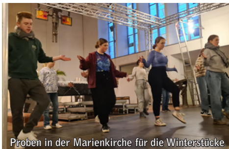
Proben in der Marienkirche für die Winterstücke

Allerdings ist ein Kirchenschiff von Haus aus natürlich kein Theater: „Wir brauchen eine Bühne und insbesondere eine für Theater- bzw. Kulturveranstaltungen ausgelegte Licht- und Tontechnik“, so Kämmer. Deshalb hat sich die Stadt entschieden, diese Technik anzuschaffen, wobei diese nicht nur für die Marienkirche und alleinig für das Wintermusical, sondern auch für andere Veranstaltungen und Veranstaltungsorte im Stadtgebiet genutzt werden kann. Besonders erfreulich: die Anschaffung der Technik wird mit bis zu 55 Prozent der förderfähigen Kosten durch das LEADER-Programm gefördert. „In einer etwas anderen Konstellation hatten wir bereits eine Klein-