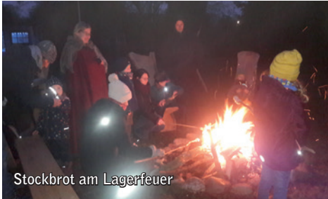
Stockbrot am Lagerfeuer

Am Sonntag, dem 15.12.2024 (3. Advent) verwandelt sich das Privatgrundstück im Schürffeld 4 in Georgsmarienhütte-Kloster Oesede wieder in ein vorweihnachtliches Ambiente. Bereits zum vierten Mal veranstaltet die Familie Demircioglu einen privaten Weihnachtsmarkt, der für die Öffentlichkeit frei zugänglich ist. Der Weihnachtszauber beginnt um 12 Uhr und endet gegen 18 Uhr. Neben deftigen Speisen gibt es wieder Kuchen, Waffeln sowie leckere Heiß- und Kaltgetränke (Glühwein, Kinderpunsch und selbstgemachter Apfelsaft). Alle Zutaten sind aus biologischem Anbau und auch vegane Speisen werden wieder angeboten. Auf dem 4000 m 2 großen Naturgelände präsentieren wieder einige Aussteller ihre Advents- und Weihnachtsprodukte. Für die Kinder wird am Lagerfeuer Stockbrot gebacken. Außerdem gibt es wieder ein kleines mittelalterliches Heerlager und Bogenschießen. Alle Speisen und Getränke sind gegen eine Spende erhältlich. Ein Teil der Spenden geht an den gemeinnützigen Verein „nature kids & teens e.V.“. Es gibt noch freie Standplätze. Weitere Informationen beim Veranstaltungsleiter Tobias Demircioglu, Mobil: 0172-8726403 oder per Mail: tobias.demircioglu@ok.de