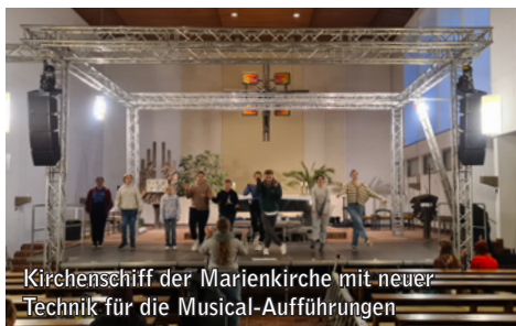
Kirchenschiff der Marienkirche mit neuer Technik für die Musical-Aufführungen