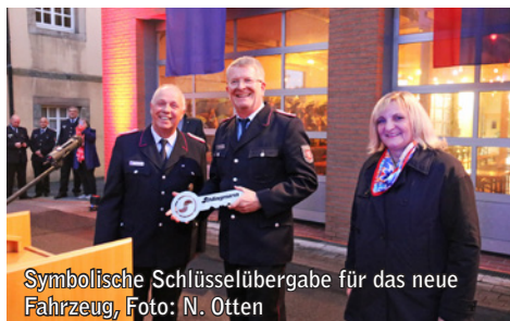
Symbolische Schlüsselübergabe für das neue Fahrzeug, Foto: N. Otten

„Die Sicherstellung des Brandschutzes gehört zum Kernbereich der Aufgaben, die eine Kommune gegenüber ihren Bürgerinnen und Bürgern zu erfüllen hat. Zur Erfüllung dieser Auf-