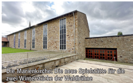
Die Marienkirche: Die neue Spielstätte für die zwei Winterstücke der Waldbühne

sich ein eher klassisches Theaterstück und auch der Aufführungsort für beide Vorstellungen ist neu. Erstmals wird die Marienkirche in Kloster Oesede durch die Waldbühne als Veranstaltungsort genutzt.