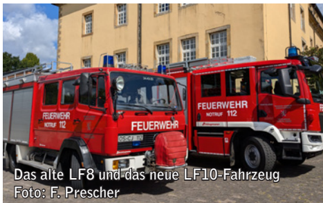
Das alte LF8 und das neue LF10-Fahrzeug

Obwohl die offizielle Übergabe erst jetzt stattfand, ist das Fahrzeug bereits seit dem 3. Juli 2024 bei der Feuerwehr Kloster Oesede im