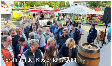
Eröffnung der Kloster Klipp 2024

ordnung des Ausschusses für Ordnungswesen, Kultur und Stadtmarketing. Anlass der geplanten Neufassung sind vorrangig redaktionelle Änderungen, zudem sollte in einem ersten Vorschlag die Kloster Klipp als dort hinterlegte Kirmes aus der Marktordnung herausgenommen werden. Im Rat soll die Neufassung am 14. November abschließend beraten werden, dann allerdings weiterhin mit der Kloster Klipp als Teil der Satzung.