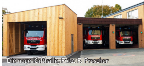
Die neue Kalthalle, Foto: F. Prascher

Sektionaltor und technischer Ausstattung. Für einen schnellen Einsatz ist das Fahrzeug dauerhaft an die Druckluft- und Stromversorgung angeschlossen. Die Abgase werden über eine Abgasabsaugung aus der Halle geführt.