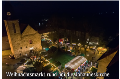
Weihnachtsmarkt rund um die Johanneskirche

An beiden Tagen können die Besucher das besinnliche Lichtermeer in der Johanneskirche bewundern, weihnachtlichen Drehorgelklängen lauschen und dem Nikolaus begegnen. Das Markttreiben bietet zahlreiche Stände mit Kunsthandwerk, kulinarischen Spezialitäten und Geschenkideen.