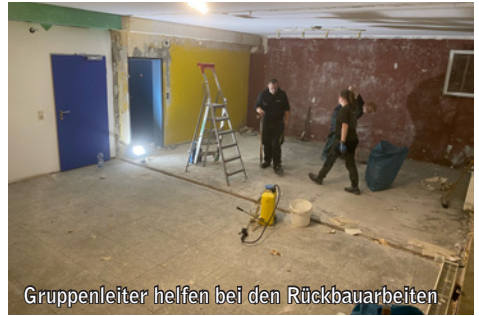
Gruppenleiter helfen bei den Rückbauarbeiten.

In den letzten Monaten wurden die Planungen für die Renovierung des Edith-Stein-Hauses vorangetrieben. Mehrere Förderanträge wurden gestellt und schließlich bewilligt. Finan-