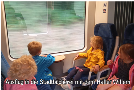
Ausflug in die Stadtbücherei mit dem Haller Willem

Was für ein aufregender Tag in unserem Kindergarten. Vier Kinder unserer Kita St. Johann fuhren mit zwei Fachkräften mit dem Haller Willem nach Oesede. Zum Bahnhof laufen, eine Fahrkarte kaufen, auf den Zug warten, einsteigen, wieder aussteigen... Das hat den Kindern viel Spaß gemacht.