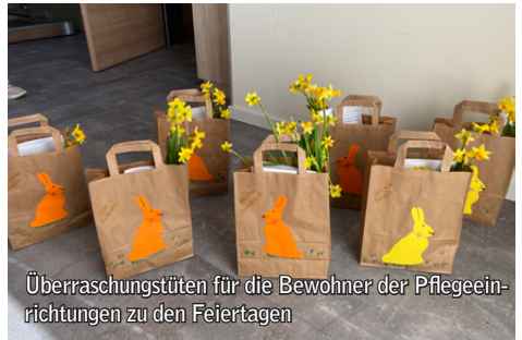
Überraschungstüten für die Bewohner der Pflegeeinrichtungen zu den Feiertagen

Fünf Initiativen werden Anfang September mit dem Doris-Janssen-Reschke-Diakoniepreis für ihr herausragendes Engagement ausgezeichnet. Alle zwei Jahre lobt die Diakoniestiftung im Osnabrücker Land diesen Preis aus. Das Ziel: Motivation für weitere diakonische Projekte und ein Herz für den Nächsten. Es gab so viele gute Ideen, die eingereicht worden waren, dass die Jury Mühe hatte, die Preisträger zu ermitteln. Deshalb wurden zwei 1. Preise und drei 2. Preise vergeben.