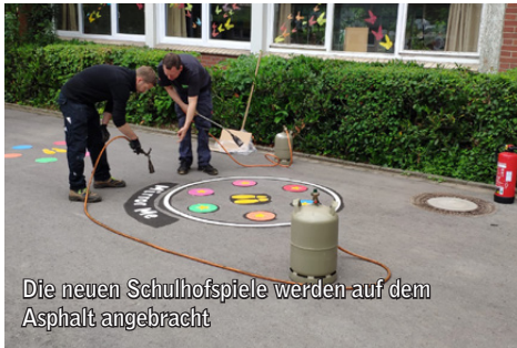
Die neuen Schulhofspiele werden auf dem Asphalt angebracht

Kloster Oesede gesponsert. Die Erstklässler können sich auf schöne Kleinigkeiten und Werbeartikel von regionalen Firmen freuen. Der Förderverein wünscht allen Kindern, besonders den neuen Schülern, einen guten Start ins Schuljahr und bedankt sich bei allen Unterstützern.