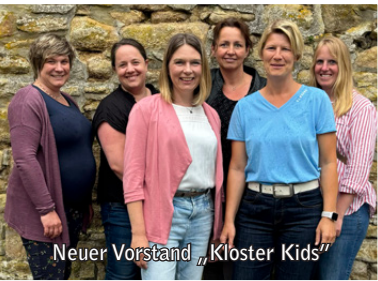
Neuer Vorstand „Kloster Kids“