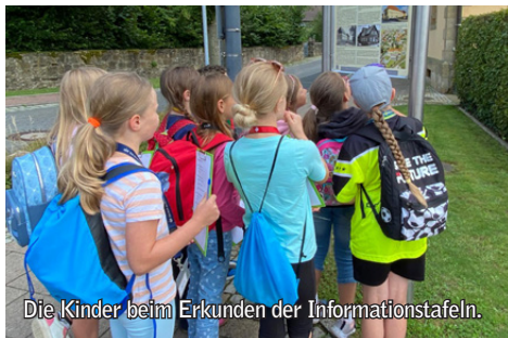
Die Kinder beim Erkunden der Informationstafeln.

Auch in diesem Jahr beteiligte sich der Heimatverein Kloster Oesede an der Ferienpassaktion der Stadt Georgsmarienhütte. Die Klosterrallye, ein Angebot des Heimatvereins Kloster Oesede im Rahmen der Ferienpassaktion, fand auch in diesem Jahr wieder großen Anklang.