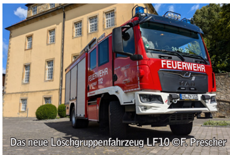
Das neue Löschgruppenfahrzeug LF10

Das neue LF10 basiert auf einem MAN TGM-Fahrgestell und verfügt über eine Leistung von 290 PS sowie Allradantrieb. Diese Eigenschaften gewährleisten eine erhöhte Mobilität und Einsatzfähigkeit auch in schwierigem Gelände.