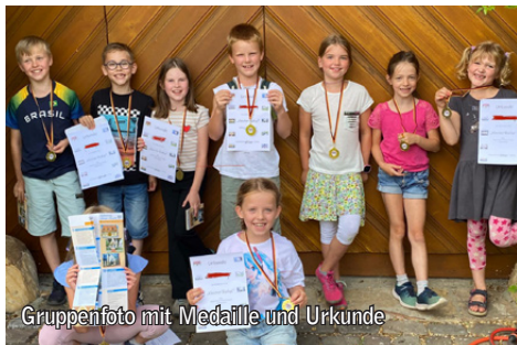
Gruppenfoto mit Medaille und Urkunde

Am 24. und 25. Juli konnten wir zwanzig Kinder an der Klosterpforte begrüßen. Mit einem Fragebogen in der Hand ging es zu den verschiedenen Informationstafeln des Kulturweges Kloster Oesede. An den Stationen erfuhren die Teilnehmer einiges über die Geschichte des Ortes, z.B. über die alte Schule, das Kloster, den Bergbau und den alten Bahnhof. Fragen konnten schnell beantwortet werden.