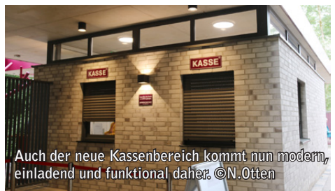
Auch der neue Kassenbereich kommt nun modern, einladend und funktional daher.

Mit Blick auf die verbleibende Saison zeigt sich das Team der Waldbühne optimistisch und freut sich auf weitere gut besuchte Vorstellungen.