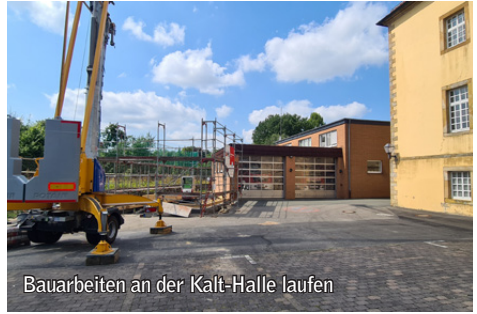
Bauarbeiten an der Kalt-Halle laufen

Am südlichen Ende des Feuerwehrhauses in Kloster Oesede haben die Bauarbeiten zur Errichtung einer Kalthalle begonnen. Die temporäre Halle wird als zusätzliche Unterbringungsmöglichkeit für die Einsatzfahrzeuge der Ortsfeuerwehr Kloster Oesede benötigt, da mit der Auslieferung des neuen Löschgruppenfahrzeugs (LF 10) nicht mehr sämtliche Fahrzeuge im Gebäude des Feuerwehrhauses Platz haben.