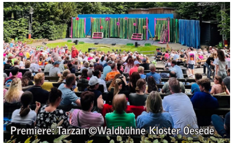
Premiere: Tarzan

Die Bereitschaft vieler Gäste, auch kurzfristig je nach Wetterlage über einen Besuch der Waldbühne zu entscheiden, hat sich für die Waldbühne ausgezahlt. Das vielfältige Programm wird hervorragend angenommen.