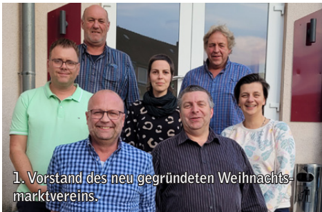
1. Vorstand des neu gegründeten Weihnachtsmarktvereins.

In kommenden Sitzungen werden die Weichen für die Zukunft des Weihnachtsmarktes gestellt. Das Gesamtkonzept wird in der Mitgliederversammlung im Herbst vorgestellt. Der Verein freut sich über neue Mitglieder und Unterstützung bei der Vorbereitung und Durchführung des Weihnachtsmarktes, der wie gewohnt am ersten Adventswochenende stattfinden wird.