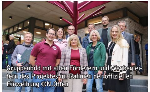
Gruppenbild mit allen Förderern und Wegbegleitern des Projektes im Rahmen der offiziellen Einweihung

Der neue Eingangsbereich, der mit Unterstützung des Dorfentwicklungsprogramms und zahlreicher Spender realisiert wurde, trägt maßgeblich zum verbesserten Gesamterlebnis bei.