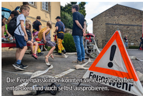
Die Ferienpasskinder konnten viele Gerätschaften entdecken und auch selbst ausprobieren.

An einem Mittwoch in den Sommerferien konnten 30 Kinder im Alter von 7 bis 12 Jahren einen spannenden Nachmittag bei der Freiwilligen Feuerwehr Kloster Oesede verbringen. Bei strahlendem Sonnenschein konnten die Kinder an verschiedenen Stationen die Tätigkeiten der Feuerwehr kennenlernen und ausprobieren. Vom Tragen des schweren Atemschutzes, dem Wasserpumpen mit der Kübelspritze, dem Kuppeln von Druckschläu-