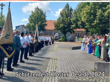
Schützenfest Kloster Oesede 2024