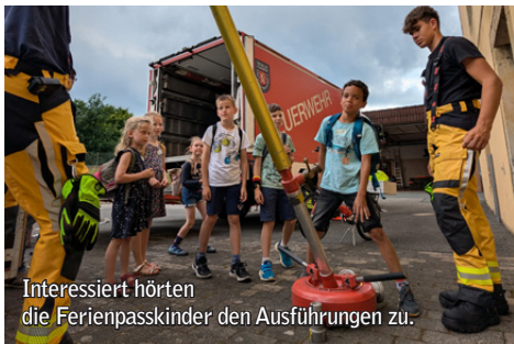
Interessiert hörten die Ferienpasskinder den Ausführungen zu.

An einem Mittwoch in den Sommerferien konnten 30 Kinder im Alter von 7 bis 12 Jahren einen spannenden Nachmittag bei der Freiwilligen Feuerwehr Kloster Oesede verbringen. Bei strahlendem Sonnenschein konnten die Kinder an verschiedenen Stationen die Tätigkeiten der Feuerwehr kennenlernen und ausprobieren. Vom Tragen des schweren Atemschutzes, dem Wasserpumpen mit der Kübelspritze, dem Kuppeln von Druckschläu-