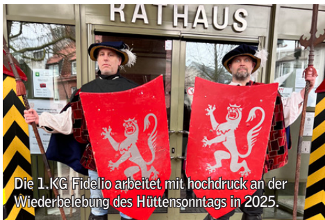
Die 1.KG Fidelio arbeitet mit Hochdruck an der Wiederbelebung des Hüttensonntags in 2025.