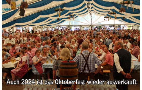
Auch 2024 ist das Oktoberfest wieder ausverkauft

Am Samstag, den 14. September 2024, findet zum 15. Mal das Oktoberfest an der Sporthalle zur Waldbühne in Kloster Oesede statt. Ab 12:00 Uhr mittags startet das Blasorchester Borgloh mit zünftiger Blasmusik. Nach der offiziellen Eröffnung sorgt die fünfköpfige Band "Bayernmän" mit bayrischer Musik für tolle Wiesen-Stimmung.